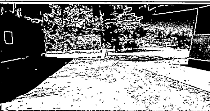
Foto 5: Entrada al establecimiento, lado Sur. Para fundición de plancha de concreto con medidas descritas en fotografía No. 1