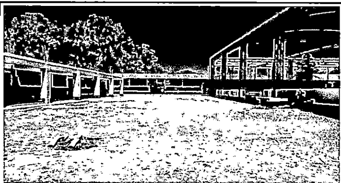
Foto 4: Fundición planchas de concreto en patio frontal, 27.85 X 7.50 m 2 lado Norte