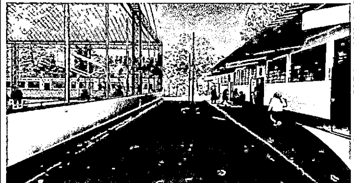
Foto 2: Vista de otro ángulo de patio frontal lado Oriente, medidas descritas en fotografía No. 1