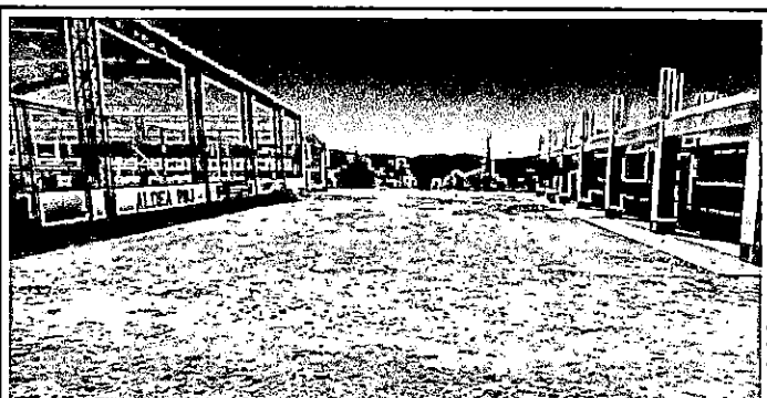
Foto 6: Vista de otro ángulo de patio frontal para fundición de plancha de concreto con medidas descritas en fotografía No. 4

Observación: El proyecto a realizarse fue decidido por inconveniente en época lluviosa ya que se forma acumulación de agua en el suelo y en verano formación de polvo que lleva el viento hacia las aulas.