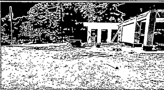
Foto 3: Fundición planchas de concreto en patio lateral, 5 X 15 m 2 lado Oriente